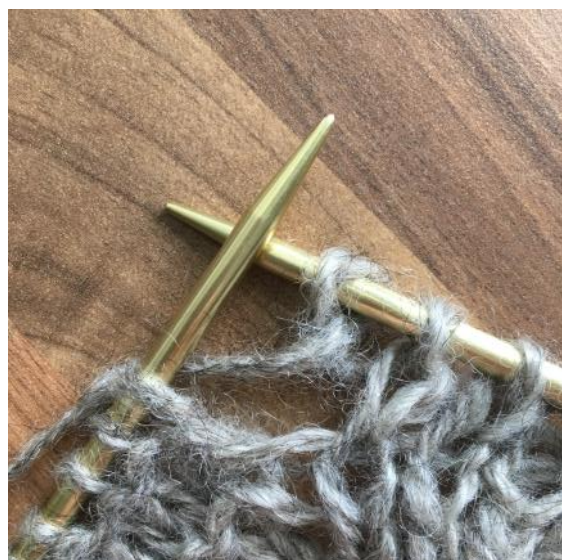
Umschlag für links gerichtete Zunahme nach dem Zopf