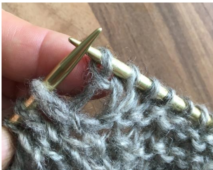
Umschlag für rechts gerichtete Zunahme vor dem Zopf